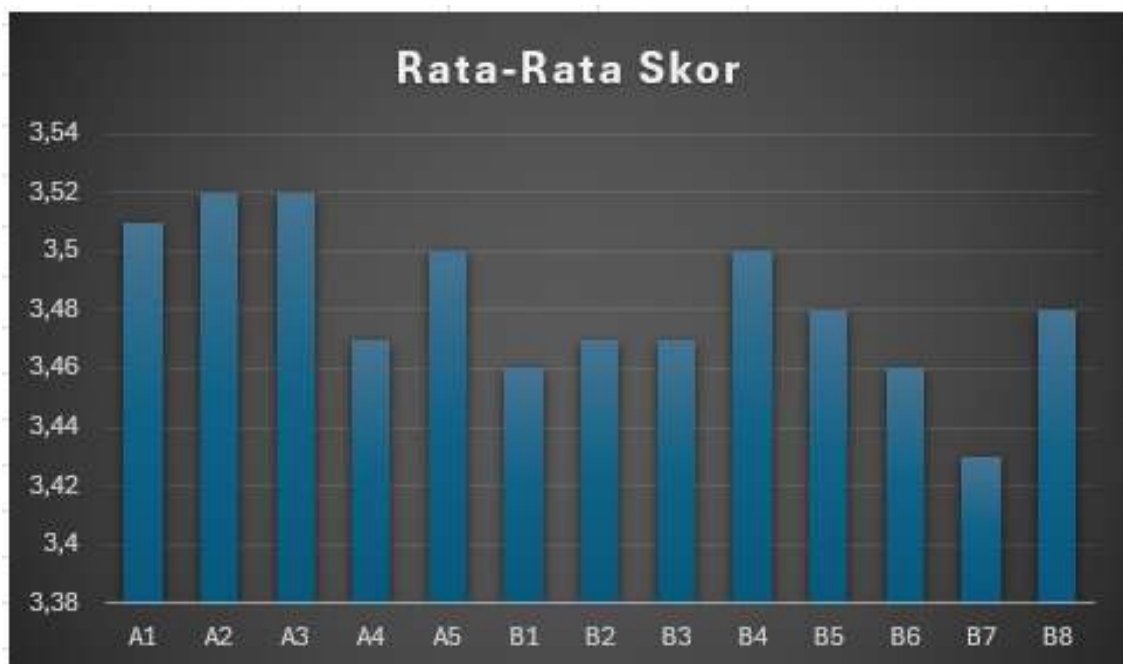
Gambar 1. Hasil survei kepuasan mahasiswa Fakultas Ilmu Keolahragaan dan Kesehatan UNY

Survei kepuasan mahasiswa mengungkapkan gambaran komprehensif tentang efektivitas layanan di lingkungan kampus. Dalam domain kemahasiswaan, seluruh aspek—mulai dari penalaran (3,51), minat khusus